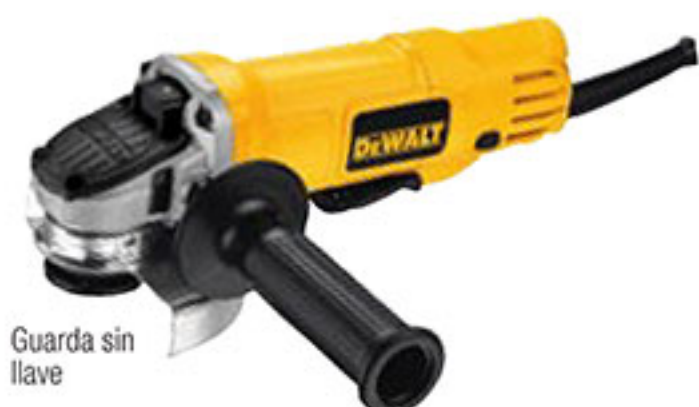
Guarda sin llave